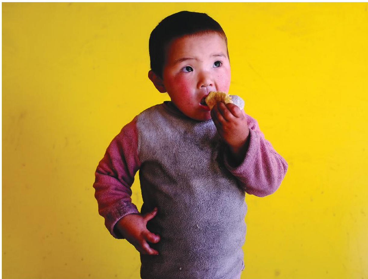
Тавь хүртэлх насны хүүхэд, Улаан-Уул сум (Хөвсгөл аймаг)