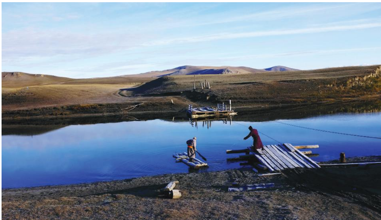
Ренчинлхүмбэ сум хүрэх замд гол гатлах сал (Хөвсгөл аймаг)