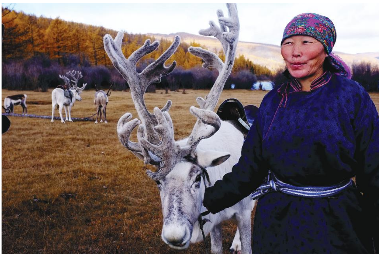
Цаатан малчин эмэгтэй, Цагааннуур сумын цаатны суурь дээр (Хөвсгөл аймаг)