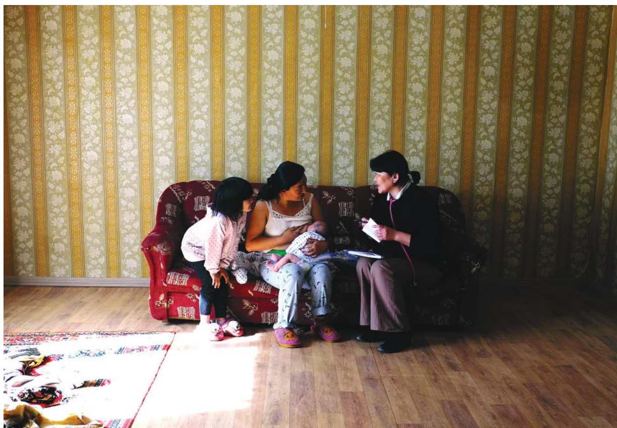
Казах айлд судалгаа авч байгаа нь, Налайх дүүрэг