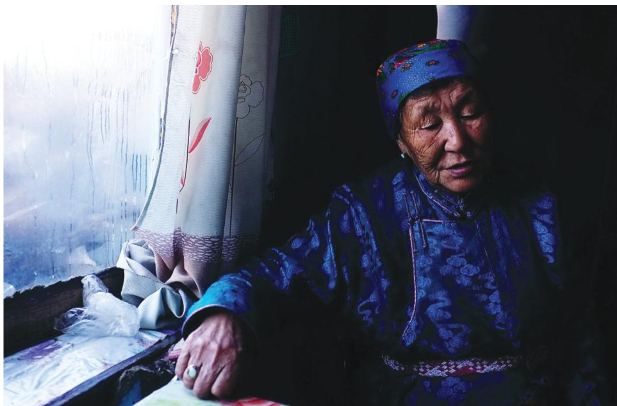
Дархад удган, Хөвсгөл аймгийн Ренчинлхүмбэ сум