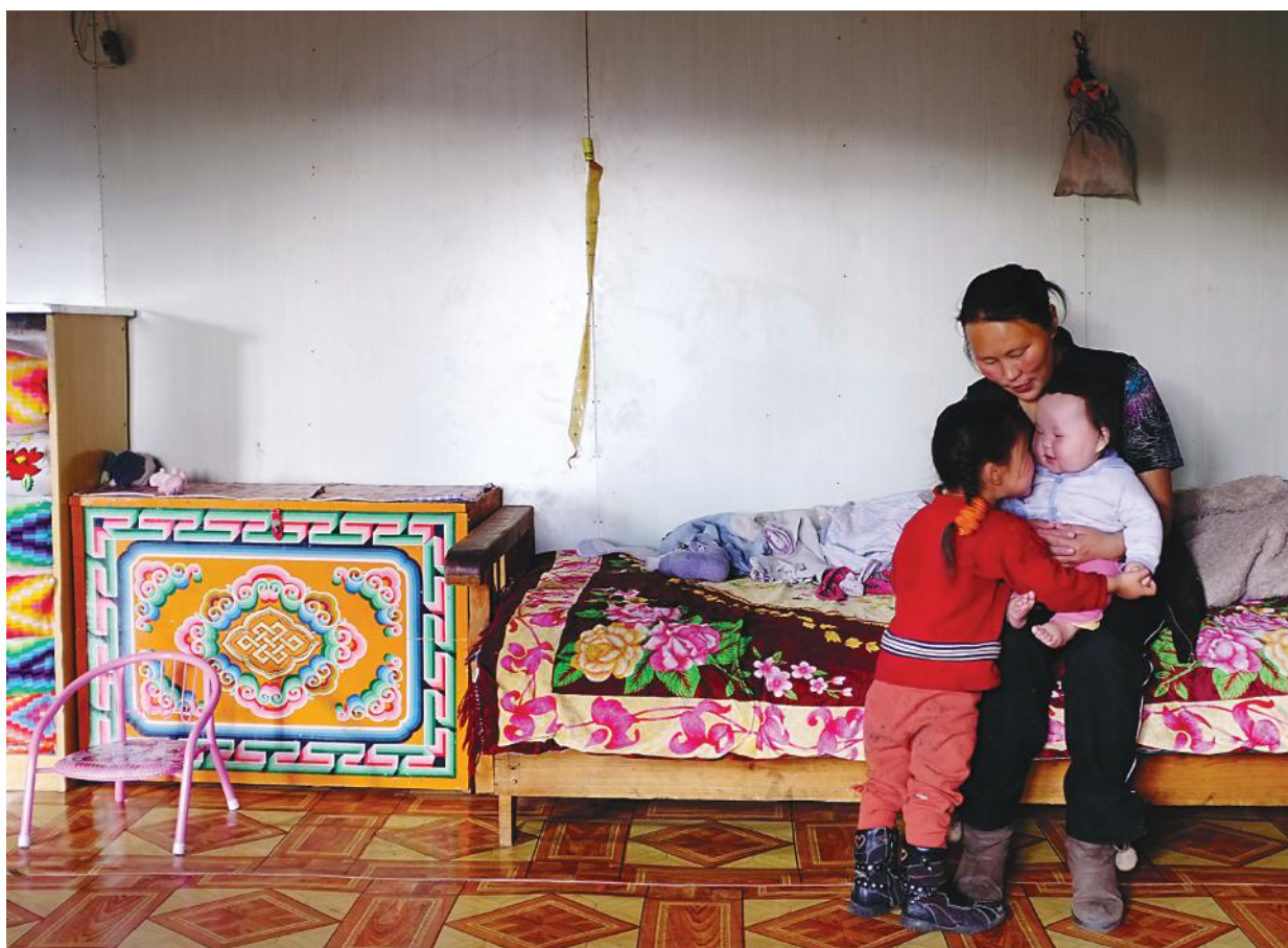
Сумын төвд өвөлждөг Цаатан гэр бүл, Хөвсгөл аймгийн Цагааннуур сум