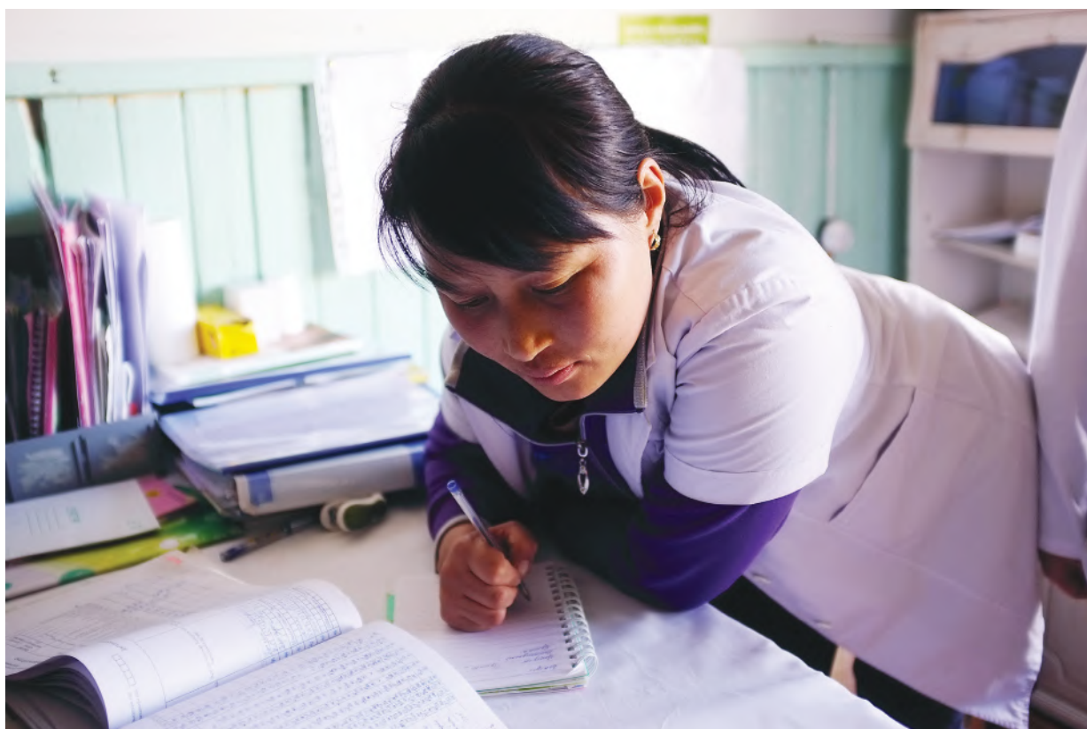
Сумын эрүүл мэндийн төвийн ажилтан, Хөвсгөл аймгийн Цагааннуур сум