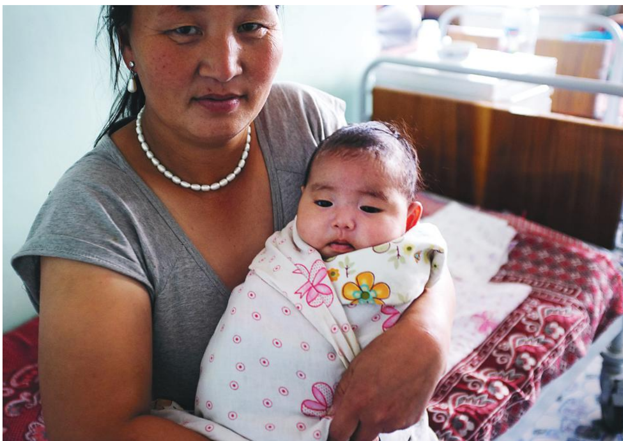
Хотгойд эх хүүхэд хоёр, Мөрөн хотын Нэгдсэн эмнэлэг (Хөвсгөл аймаг)