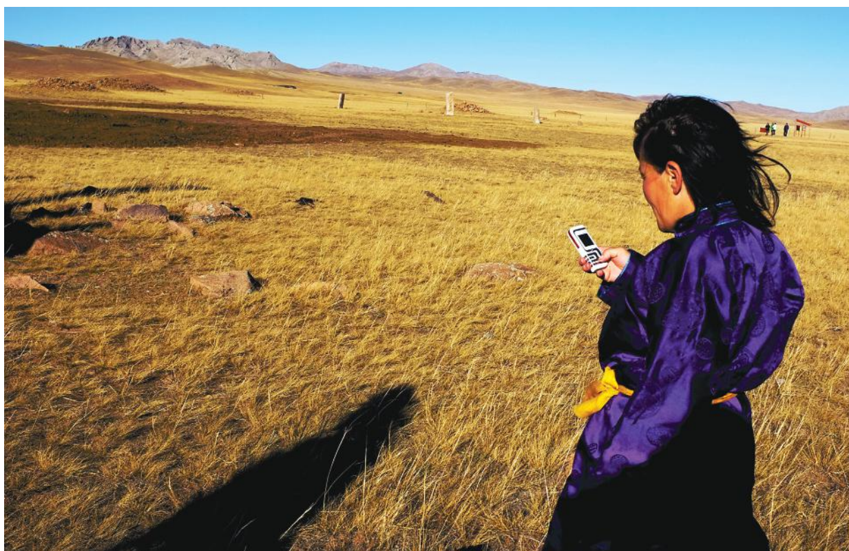
Мөрөн хотын захад, Уушгийн өврийн эртний хүн чулууны ойролцоо (Хөөсгөл аймаг)